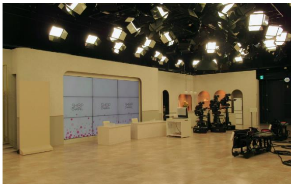
番組放送スタジオ