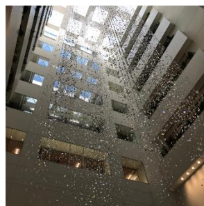
開放感のある吹き抜け