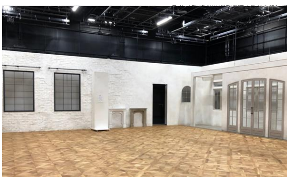
プロモーションビデオ撮影スタジオ