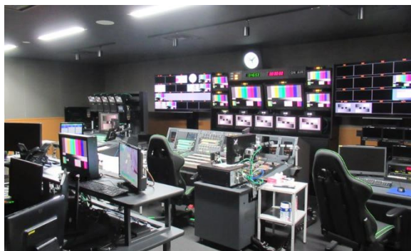
サブコントロールルーム（副調整室）